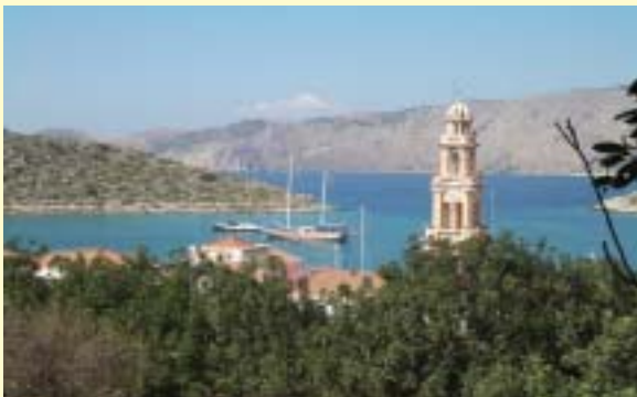
Kykladen und Peloponnes ab Athen